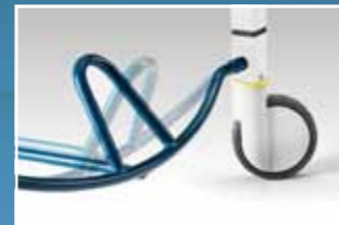
Fußbügel für zentrale Verriegelung der Rollen/Führungsrollenfunktion