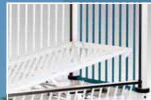
T/AT-Verstellung mit Gasfederunterstützung