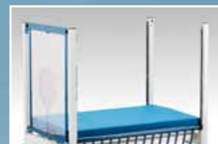
Kopf- und Fußteil mit herausnehmbaren und austauschbaren Einsätzen (Gitterstabrahmen oder Plexiglas)