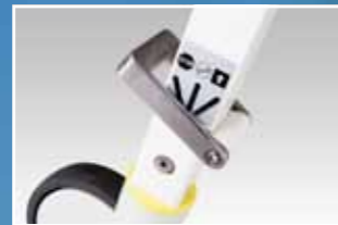
Fußbedienung Seitenteile Rollen Ø 150 mm