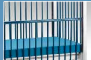
Höhe der Seitenteile in : hoch, halbhoch und niedrig