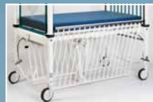
Seitenteile können unter die Liegefläche mit Gasfederunterstützung weggedreht werden