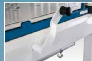
Mechanische Hoch-/Tiefverstellung. Option: Elektrisch